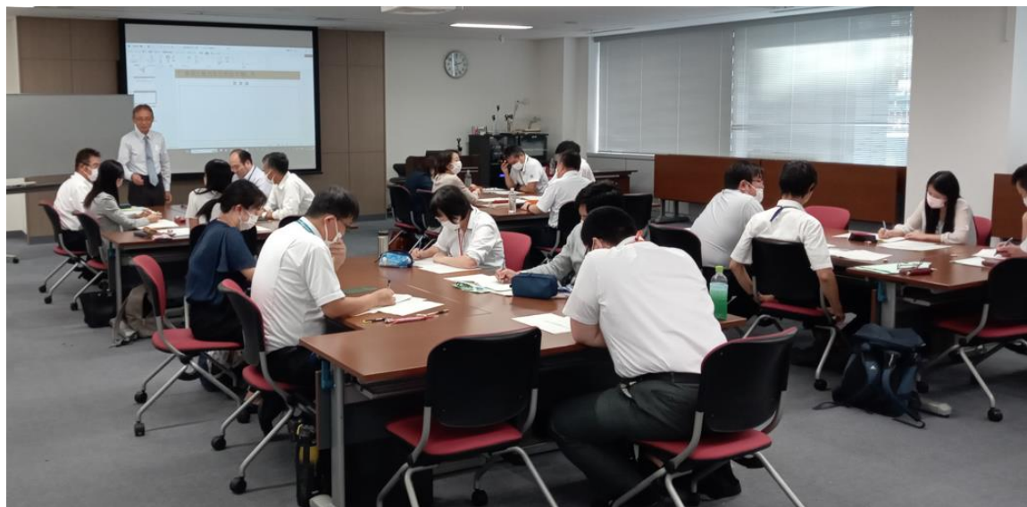
『意欲と能力を引き出す 部下指導研修』 (某県市町村職員様合同研修)