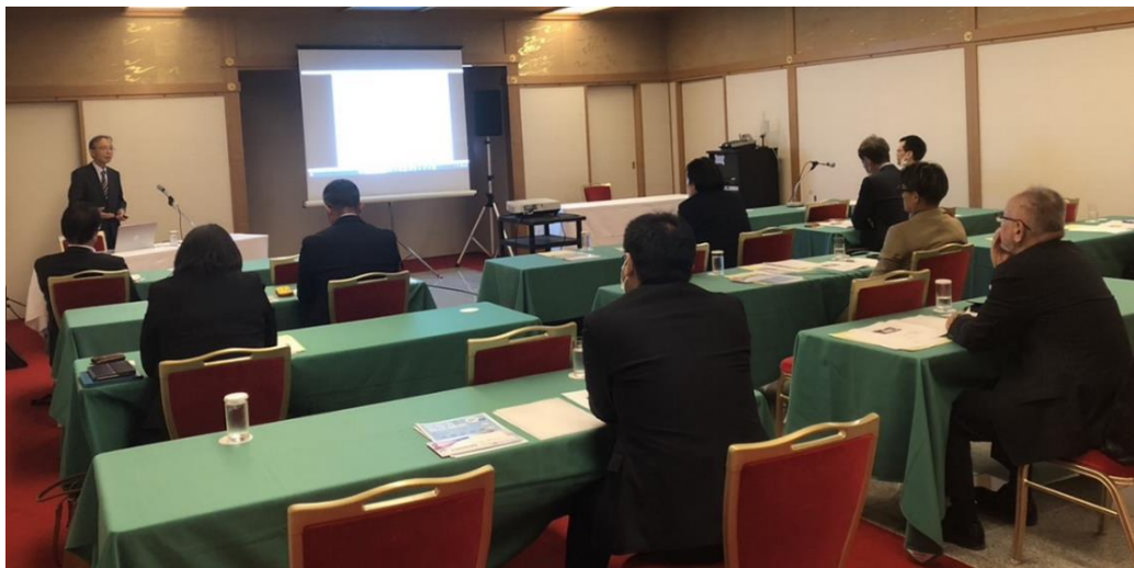
『古典から学ぶ経営戦略』 ～孫子の兵法と「論語と算盤」～ (某県経営者団体様勉強会)